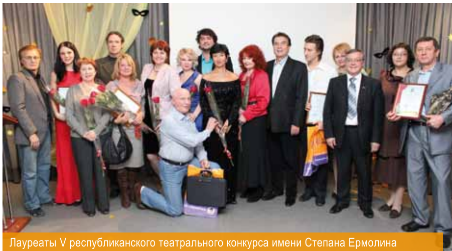
Лауреаты V республиканского театрального конкурса имени Степана Ермолина