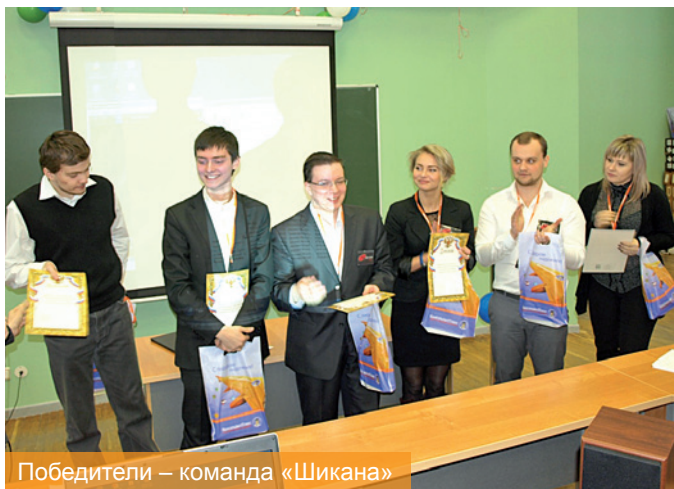
Победители – команда «Шикана»

Торжественное награждение победителей и участников брейн-ринга состоялось в этот же день. Всем участникам были вручены подарки от КонсультантПлюс: книга «Кодификация российского права» под редакцией Дмитрия Медведева, диски «Классика российской цивилистики» и новый выпуск «КонсультантПлюс: Высшая школа», а также сувенирная продукция. Победителям вручили именные дипломы и фирменные флэш-накопители с логотипом компании «КонсультантПлюсКоми».